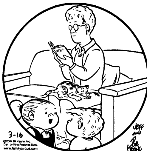
— Bill Keane, "The Family Circus" (adapted)

33 In Spanish, write a story about the situation shown in the picture below. It must be a story relating to the picture, not a description of the picture. Do not write a dialogue.