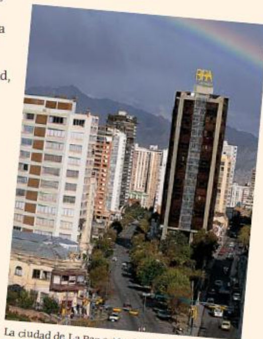
La ciudad de La Paz está a 3.650 metros sobre el nivel del mar.