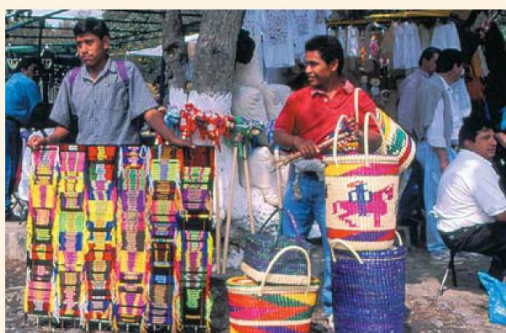
El Bazar Sábado.

almacenes mexicanos Liverpool o el Palacio de Hierro, y también Zara, una tienda de ropa de España. Los jóvenes que quieren ir de compras a un lugar más animado 3 van a los tianguis , mercados donde se puede regatear 4 y encontrar ropa barata y divertida. Los que quieren buenas gangas van a El Monte de Piedad, una casa de empeños 5 en el centro de la capital. Al sur, en el barrio colonial San Ángel, está el famoso Bazar Sábado, donde todos los sábados venden arte y artesanía 6 . Para comprar comida, muchos mexicanos van a los supermercados grandes como Soriana o Gigante donde hay de todo. Algunos mexicanos todavía prefieren ir a las tienditas—las carnicerías, las tortillerías, las dulcerías—donde el servicio es personal.