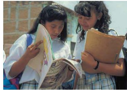
Ellas están leyendo el periódico.